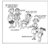
Figure 4.4 The superior teaching method